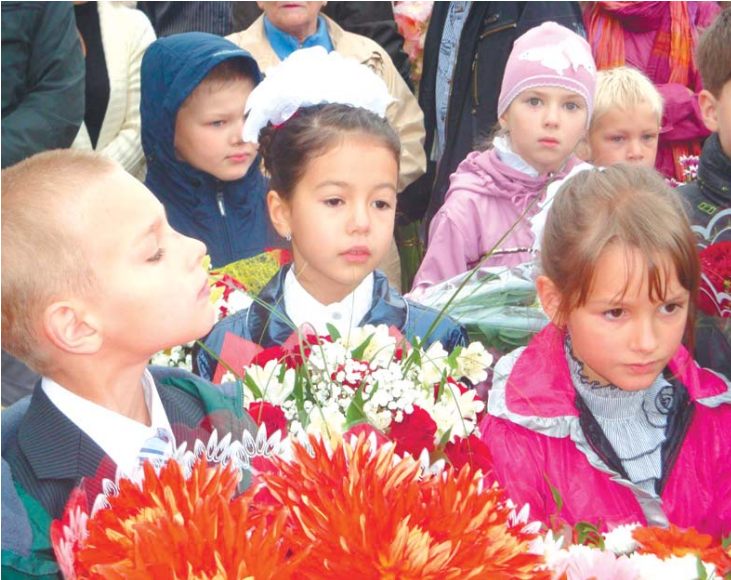
Такими были первоклассники школы № 20 в 2012 году