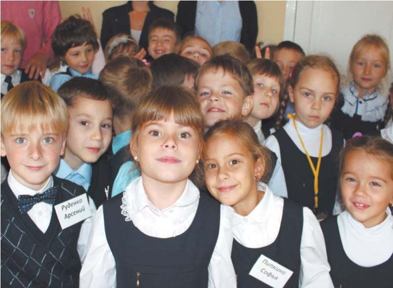
Первый раз – в первый класс, гимназия № 5 мкр Юбилейный, 2013 г.