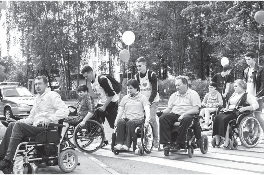
Активисты отправляются в рейд

После небольшого чаепития народный контроль выехал на рейд. Из ДиКЦ «Костино» активисты напрямую отправи-