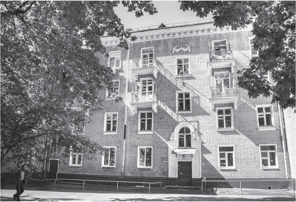
«Королёвский дом» по ул. Карла Маркса, 25