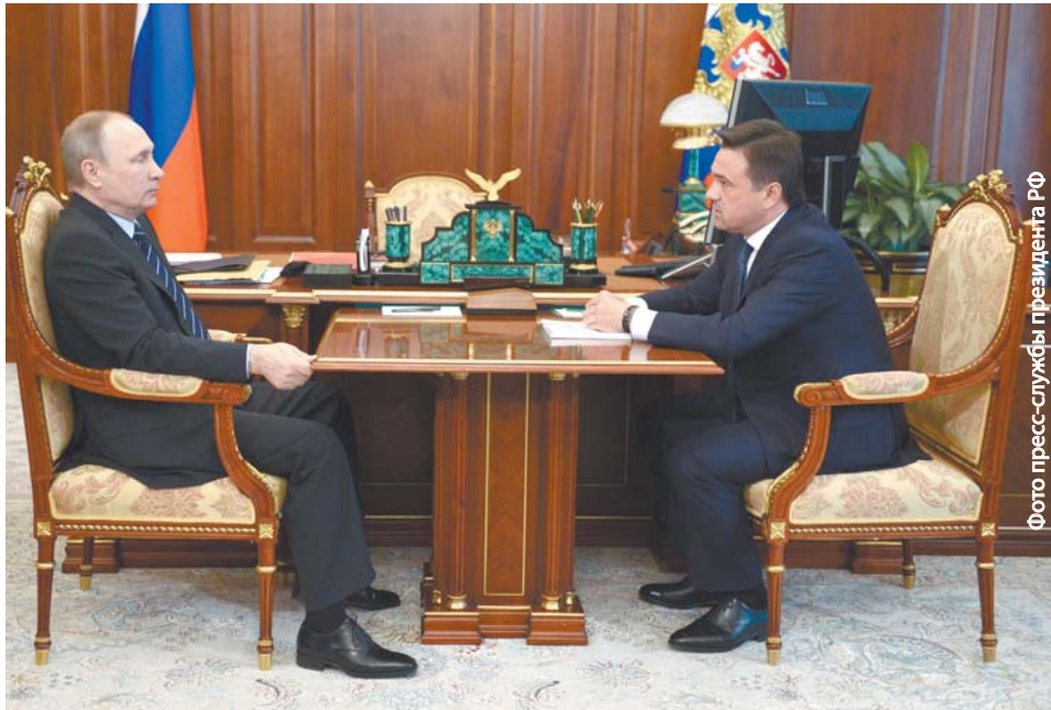
Владимир Путин и Андрей Воробьёв обсудили вопросы землепользования и кадастра

чила за сельское хозяйство, хотя костяк, хребет экономики – это промышленность. Кстати, она прибавила 14 процентов. Что касается сельского хозяйства, благодаря федеральной программе по поддержке нам удаётся привлекать инвесторов, очень крупных инвесторов; и зарубежных, и отечественных. Это касается животноводства, молочного хозяйства, тепличного, – подчеркнул Андрей Воробьёв.