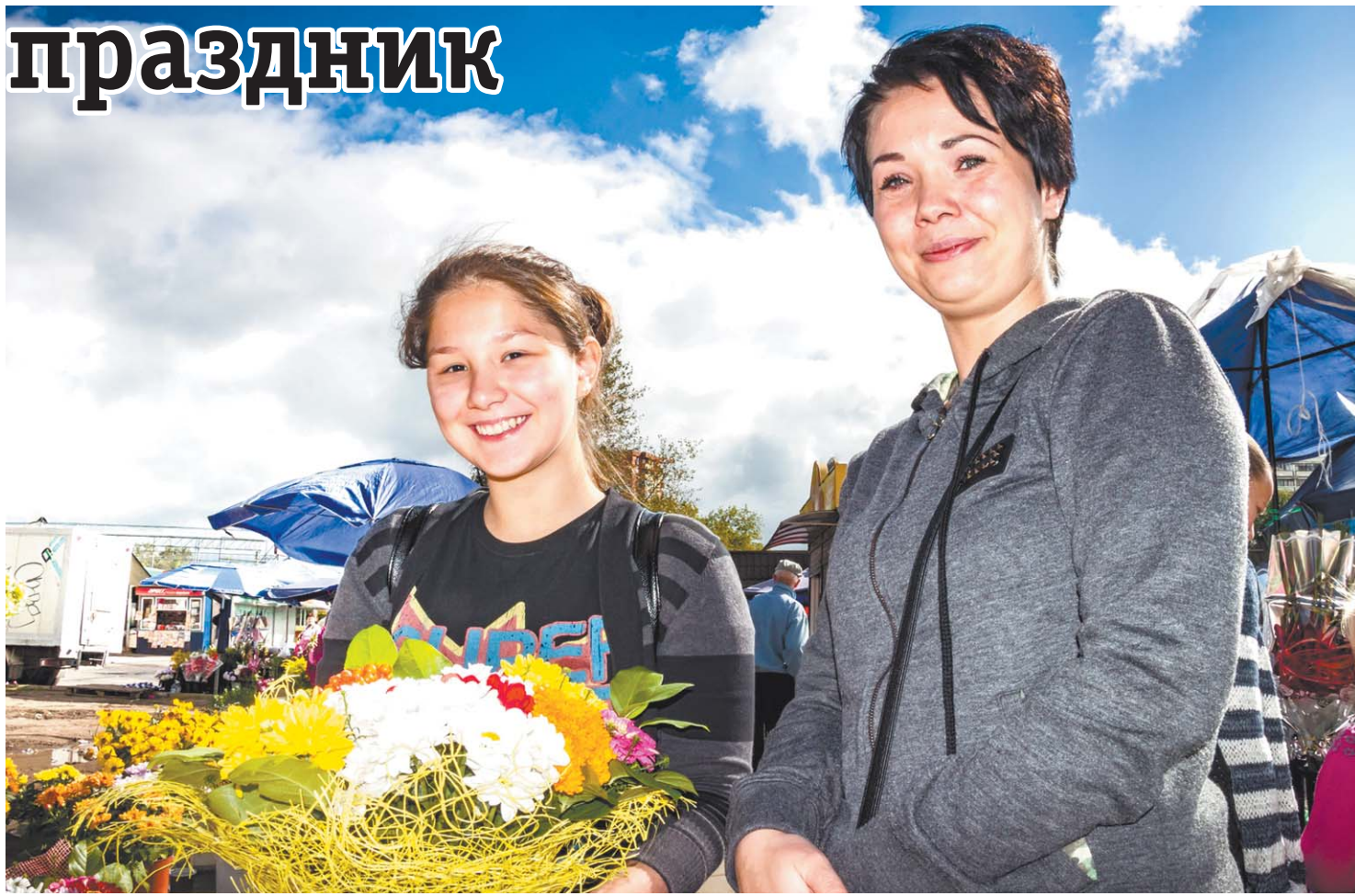
Букет для любимого педагога

ВОТ И НАСТУПИЛ ДЕНЬ, КОТОРОГО ДЕТИ И ВЗРОСЛЫЕ ЖДАЛИ С ТАКИМ ТРЕПЕТОМ! ПЕРВОЕ СЕНТЯБРЯ. НАЧАЛО НОВОЙ ЖИЗНИ ДЛЯ 2,5 ТЫСЯЧ КОРОЛЁВСКИХ ПЕРВОКЛАССНИКОВ, КОТОРЫЕ СЕГОДНЯ ВПЕРВЫЕ ПЕРЕСТУПИЛИ ШКОЛЬНЫЙ ПОРОГ.