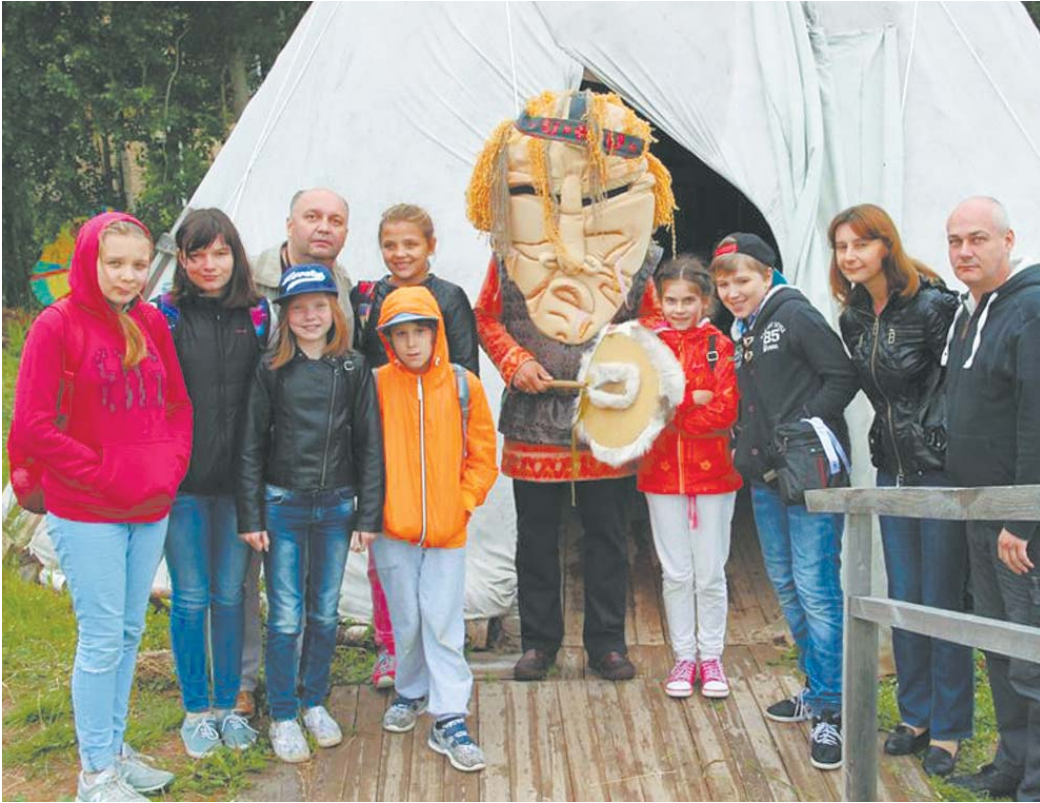
Молодёжный театральный центр при ТЮЗе на VII Всероссийском фестивале творческих мастерских «Театральные витражи» в Сыктывкаре

День знаний ярко отмечают во всех уголках Московской области, но в музее-заповеднике Антона Павловича Чехова «Мелихово» 1 сентября решили встретить необычно. В недавно отреставрированном здании знаменитой мелиховской школы, построенной при участии писателя в 1899 году, в этот день собрались жители Подмоскoвья, некогда учившиеся или работавшие в этом учебном заведении. Земская школа в селе Мелихово была закрыта в 1974 году, а до того был также основан её здание продержалось без единого капитального ремонта. За десятилетия работы из стен школы вышли сотни выпускников. В наши дни мелиховская школа стала музеем, в котором можно