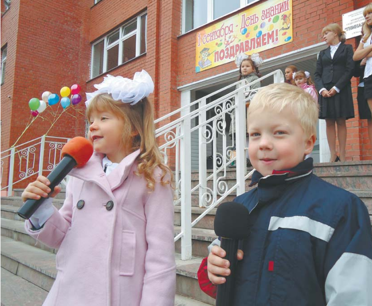
1 сентября в гимназии № 3 мкр Юбилейный, 2010 г.