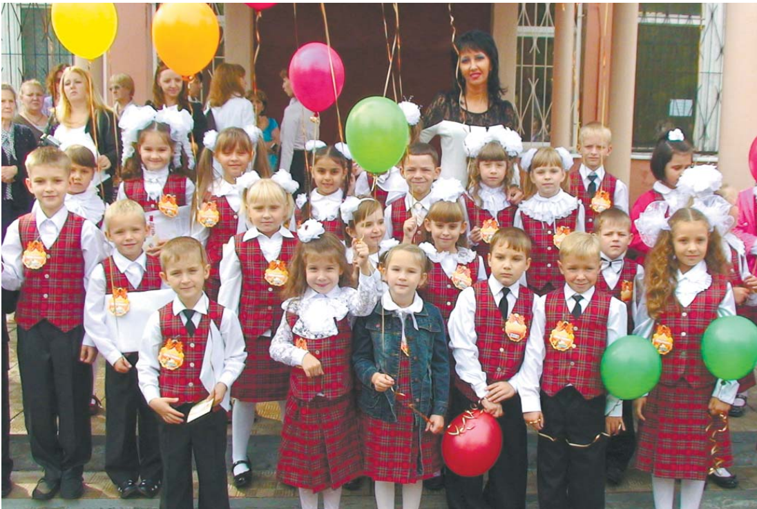
Первоклассники школы № 13, 2011 г.