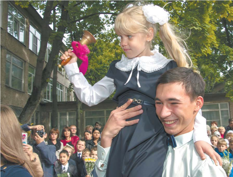
Праздничная линейка в школе № 16, 2015 г.