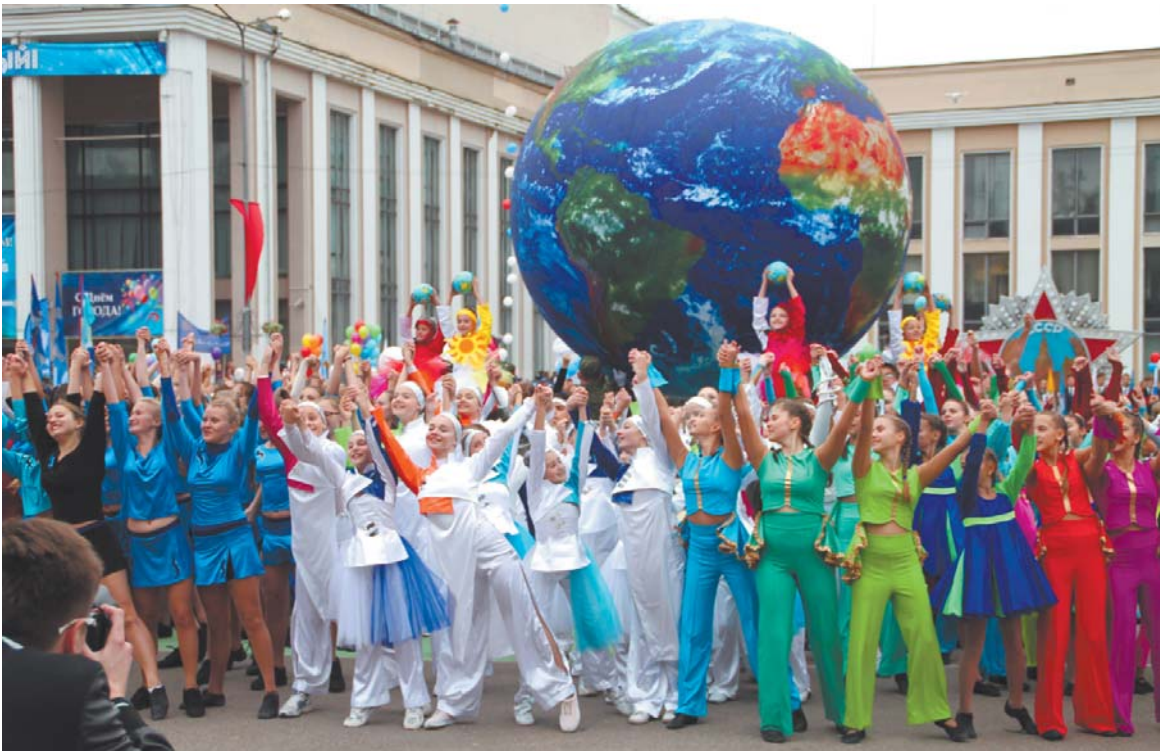
Таким было празднование Дня города в прошлом году

Уже намечена большая и разнообразная программа мероприятий, которые пройдут во всех микрорайонах города, и каждый горожанин любого возраста найдёт себе на празднике занятие по душе. Главной площадкой Дня города традиционно станет площадь Центрального дворца культуры им. Калинина. Ровно в полдень здесь начнётся концерт творческих коллективов города. И в режиме нон-стоп мероприятия, в числе которых интерактивные программы для детей, творче-