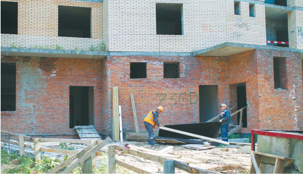
Строительство печально известного долгостроя возобновилось

Но нами были проведены обследования двух зданий, которые показали, что строения находятся не в таком уж печальном состоянии, что их невозможно восстановить. Новый генеральный подрядчик начал строительные работы на объекте около трёх недель назад. До этого шли подготовительные работы: и в плане документации, и в плане расчистки строительной площадки. – Когда мы пришли на этот объект, он был полностью завален мусором, как территория, так и подвалы и первый этаж, – говорит Чайка. – Первоначальная наша задача была привести территорию объекта в надлежащий порядок. Было вывезено порядка 450 кубометров мусора. Мы рубили деревья, восстанавливали забор, приходилось бороться с криминальными элементами. Но благодаря охране и инициативной группе жителей мы вместе привели всё в надлежащее состояние. До конца текущего года работы по усилению монолитного каркаса будут завершены. Затем рабочие приступят к восстановлению наружных ограждающих конструкций. По завершении этих работ начнётся закрытие контура, то есть установка окон, дверей и кровли. На верхних