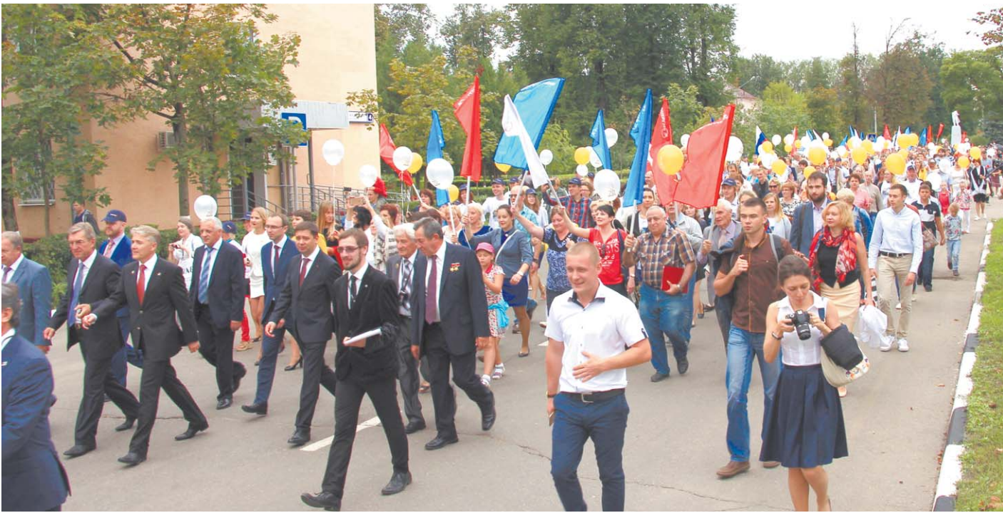
Сотрудники предприятия прошли в праздничной колонне

Признаться, такого лазерного шоу, как на этом празднике, я не видела ни разу. Вся история предприятия, портреты учё-