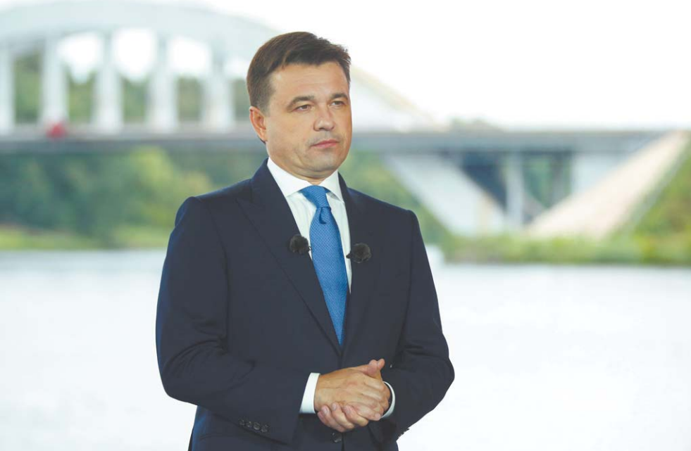
Андрей Воробьёв во время прямого эфира

Трансляция осуществлялась из открытой студии, установленной в городском округе Химки, на территории парка культуры и отдыха имени Л.Н. Толстого. На передачу были приглашены деятели образования, науки, культуры, здравоохранения, спорта, руководители профильных министерств и ведомств Московской области, главы муниципальных образований, представители общественности.